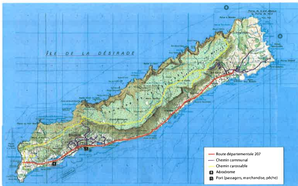
Commune de la Désirade