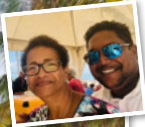
Opération de rénovation de La Chapelle de Baie Mahault