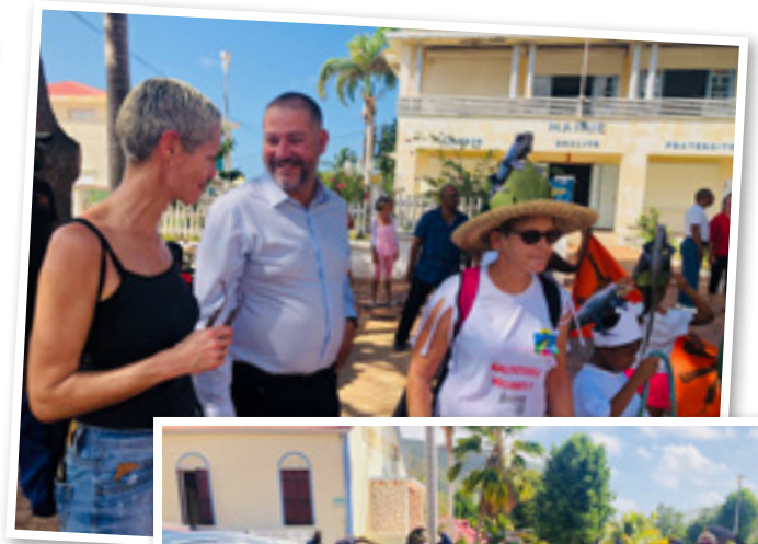
Carnaval de Désirade