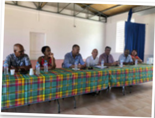
Réunion avec le Préfet sur le dossier Sargasses