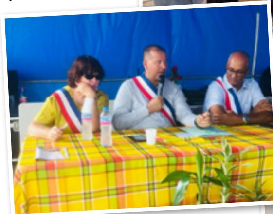
Fête des Galets