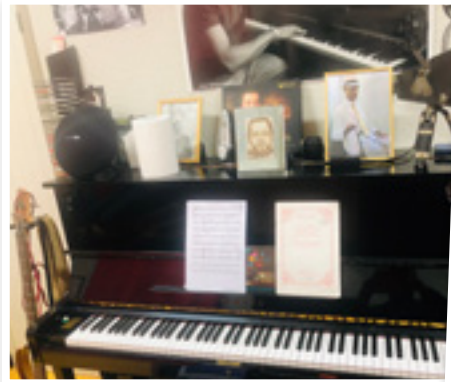
Visite de l'école de musique du Lamentin en présence du maire et du directeur de l'école