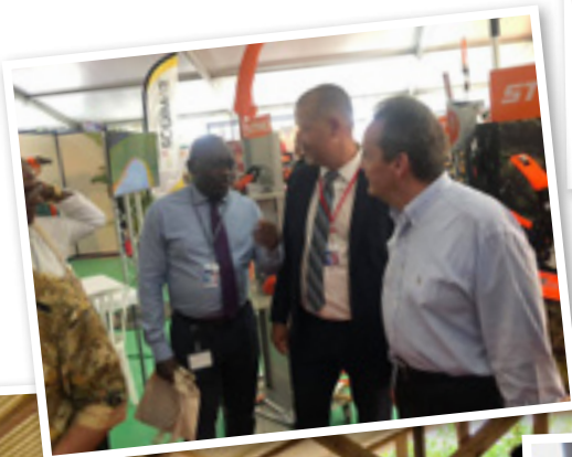
1 er Salon des Maires