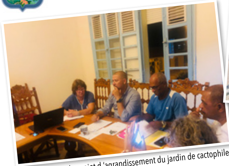
Présentation du projet d'agrandissement du jardin de cactophile.