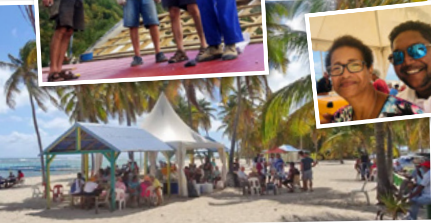
Repas de solidarité pour la rénovation de La Chapelle de Baie Mahault