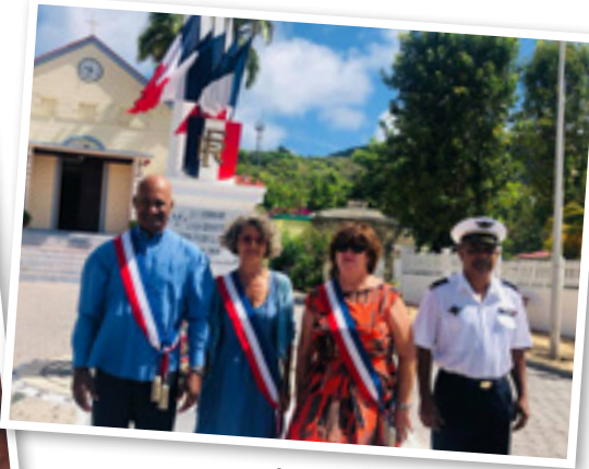
Commémoration du 8 mai